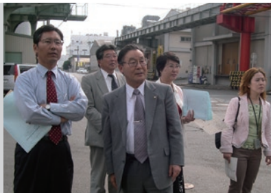
日本共産党が須崎埠頭を視察（6月10日）

市は須崎埠頭再開発で広大な市有地を売ってお金を手に入れ、そのお金を破たんした人工島事業に投入し、会計上採算がとれているように見せかけようとしている——共産党は市議会を追及しました。