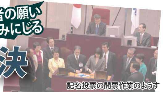
記名投票の開票作業のようす